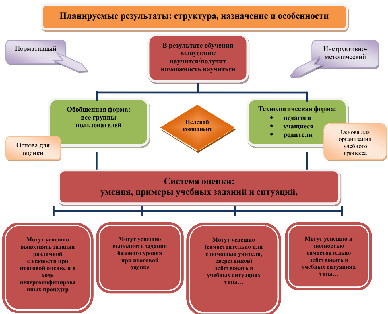
Рис. 1. Особенности структуры планируемых результатов. Функция и назначение.

Описание организации и содержания промежуточной аттестации, итоговой оценки и оценки проектной деятельности (п. 1) приводится в соответствующем разделе в образовательной программе образовательного учреждения. Используемый образовательным учреждением инструментарий для стартовой диагностики и итоговой оценки (пп. 2—5) приводится в Приложении к образовательной программе образовательного учреждения.