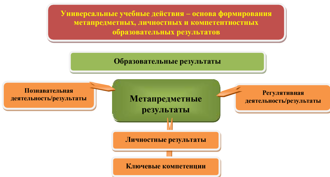
Рис. 3. Система оценки образовательных результатов

Интерпретация результатов оценки ведётся на основе контекстной информации об условиях и особенностях деятельности субъектов образовательного процесса. В частности, итоговая оценка обучающихся определяется с учётом их стартового уровня и динамики образовательных достижений.